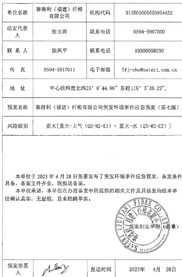
企业事业单位突发环境事件应急预案备案表